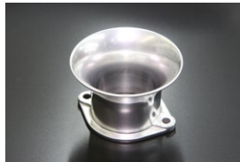
●40φ 50mm エアファンネル (STD) ・適合 SOLEX40φ WEBER40φ ¥4,500 準備中 ・品番 F-4050S (内径40)