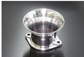
●40φ 50mm エアファンネル (ポリッシュ) ・適合 SOLEX40φ WEBER40φ ¥5,500 準備中 ・品番 F-4050P (内径40)