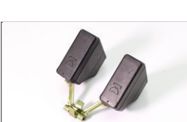
●WEBER フロート プラスチックフロート 本体 ¥9,800