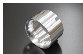
●WEBER 50φアウターベンチュリー (ジュラルミン製) (39φ 41φ 43φ 46φ) ¥5,000