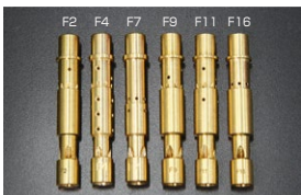
●WEBER エマルジョンチューブ F4 本体 ¥4,500 F2 本体 ¥3,500 F7 本体 ¥4,500 F9 本体 ¥3,500 F11 本体 ¥3,500 F16 本体 ¥3,500