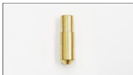
●WEBER ジェット F11スロージェット#40~#70(#5とび) 本体 ¥600 F8 スロージェット#40~#70(#5とび) 本体 ¥600 F9 スロージェット#40~#70(#5とび) 本体 ¥600 F13スロージェット#45~#65(#5とび) 本体 ¥800

※型により形状に種類あり (画像はDCOE9) DCOE9, DCOE151, DCOE152等