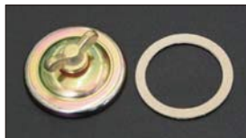
●WEBER ジェットカバー 適合: WEBER 40~50φ ・ジェットカバー 本体 ¥3,500 ・ジェットカバーピン 本体 ¥350