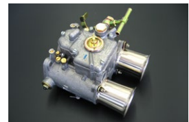
●WEBER48φキャブレター 48DCO/SP 本体 ¥155,000 /1基 ※フューエルパイプ付属 (横T.縦T.L.S) 標準左レバー付 (右レバー対応可)