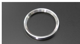
●WEBER40 ベンチュリー固定リング エアクリ用 本体 ¥1,000

社外品のファンネルを装着した際に発生するインナーベンチュリーとファンネルとの隙間を無くし、同時にベンチュリーをしっかりと固定します。