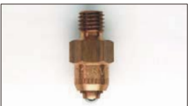
●WEBER ニードルバルブ #175 本体 ¥3,500 #200 本体 ¥3,500 #225 本体 ¥3,500 #250 本体 ¥3,500