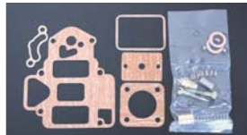
●OERリバキット 45φ 本体 ¥6,500 47φ 本体 ¥6,500 50φ 本体 ¥6,500