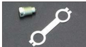
●WEBER ベンチュリーストッパーボルト 適合: WEBER 40~50φ ・ベンチュリーストッパーボルト 本体 ¥2,200 ・ロックワッシャー 本体 ¥1,700