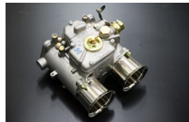
●WEBER55φキャブレター 55DCO/SP 本体 ¥223,000 /1基 ※フューエルパイプ付属 (横T.縦T.L.S) 右レバー、左レバータイプあり (画像は右レバー)