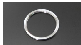
●WEBER40 ベンチュリー固定リング ファンネル用 本体 ¥1,000