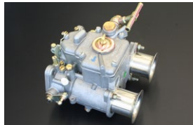
●WEBER40φキャブレター 40DCOE-151 本体 ¥117,000 /1基 ※フューエルパイプ付属 (横T.縦T.L.S) 標準左レバー付 (右レバー対応可)