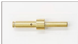
●WEBER ジェット ポンプノズル 本体 ¥1,600 #30~#65 (#5とび)