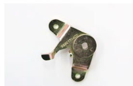
●WEBER50φ 左スロットルレバー ・ボールジョイント無し 本体 ¥5,000 ・ボールジョイント付き 本体 ¥5,700