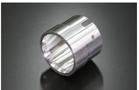
●WEBER 40φアウターベンチュリー (ジュラルミン製) (32φ 34φ 36φ) ¥4,000