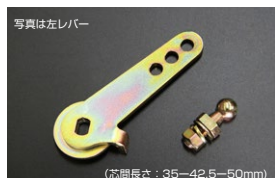
●WEBER40~45φ 調整式スロットルレバー (右レバー/左レバーあり) ・ボールジョイント無し 本体 ¥3,700 ・ボールジョイント付き 本体 ¥4,400