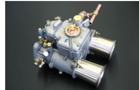
●WEBER45φキャブレター 45DCOE-152 本体 ¥117,000 /1基 ※フューエルパイプ付属 (横T.縦T.L.S) 標準左レバー付 (右レバー対応可)