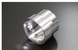
●WEBER 45φアウターベンチュリー (ジュラルミン製) (32φ 34φ 36φ 38φ 40φ) ¥4,000 ※DCOE9用とDCOE152用あり