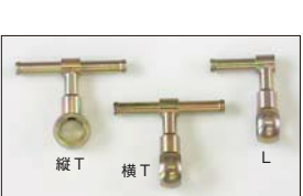
●WEBER フューエルパイプ Lパイプ 本体 ¥3,500 (横向き) Tパイプ 本体 ¥3,500 (縦向き) Tパイプ 本体 ¥3,500