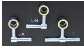
●OERフューエルパイプ 45φ~50φ T型 ¥3,700 L-A型/右向 ¥3,400 L-B型/左向 ¥3,400