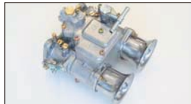
●OERキャブレター 45φ 本体 ¥52,000 47φ 本体 ¥66,000 50φ 本体 ¥98,000 (WEBERジェットタイプ) 45φ 本体 ¥55,000 (WEBERジェットタイプ) 47φ 本体 ¥59,000