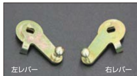
●WEBER 標準スロットルレバー 適合: WEBER 40~45φ ・スロットル右レバー 本体 ¥6,500 ・スロットル左レバー 本体 ¥6,500