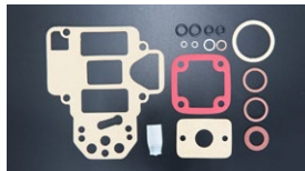
●WEBER バックセット 本体 ¥4,800

※型により形状に種類あり (画像はDCOE9) DCOE9, DCOE151, DCOE152等