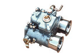
●WEBER50φキャブレター 50DCO/SP 本体 ¥188,000 /1基 ※フューエルパイプ付属 (横T.縦T.L.S) 標準左レバー付