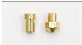
●WEBER ジェット メインジェット#100~#230(#5とび) 本体 ¥600 メインジェット#235~#260(#5とび) 本体 ¥800 エアージェット#100~#230(#5とび) 本体 ¥600 エアージェット#235~#260(#5とび) 本体 ¥800