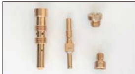
●OERジェット メインジェット 本体 ¥480 エアージェット 本体 ¥480 パイロットジェット 本体 ¥550 ポンプノズル 本体 ¥700