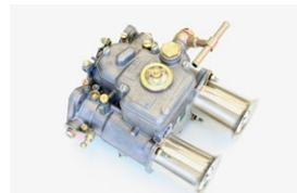
●WEBER45φキャブレター 45DCOE-9 本体 ¥145,000 /1基 ※フューエルパイプ付属 (横T.縦T.L.S) 標準左レバー付 (右レバー対応可)