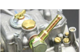
●WEBER フューエルパイプ ストレートパイプ 本体 ¥3,500