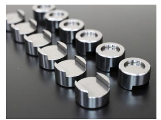
■ ロッカーガイド厚みは標準3.0mmに対し、バルブ突き出し量やカムのベースサークル、カムホルダースペースの条件により選択します。