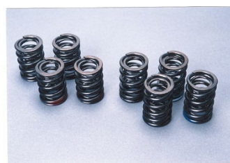
■ ストリートに最もマッチングのよい19000回転対応バルブスプリングが付属。