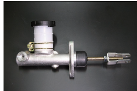
5/8クラッチマスターシリンダー 適合 : SR311 SP311 サイズ : 5/8 価格 : ¥23,000