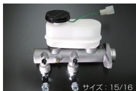
S130 ブレーキマスターシリンダー (後期 右ハンドル車用) 適合 : 81.10~83.8 (L20/L28) 価格 : ¥49,000 ※パイプの取り付け位置が標準より6cm下がります。