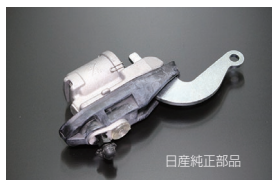
13/16標準ホイールシリンダー 適合 : GC10,GC110,510 価格 : ¥63,900/1ヶ (更新 2026.05.07)