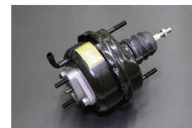
GC110 前期マスターバック サイズ : 外径143φ (ツマ部) ※スペーサー使用でハコスカ流用可 価格 : ¥80,300 (2026.4.10更新) ※在庫限り