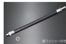
SR311/SP311 純正クラッチホース ・全長 : 275mm (ねじ部込み) ・適合 : SR311/SP311全車 ・価格 : ¥4,210 (2026.4.9更新)