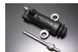
SR311 標準リレズシリンダー 適合 : SR311全車/SP311 (後期) サイズ : 3/4 (手動調整) 価格 : ¥13,410 (2026.4.9更新)