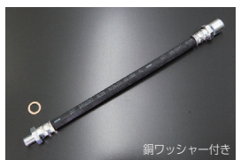
GC10, KPGC10 純正クラッチホース ・全長 : 260mm (ねじ部込み) ・適合 : GC10,KGC10,KPGC10 ・価格 : ¥2,580 (2026.4.9更新)