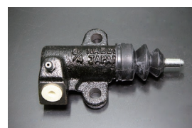
FJ20 標準リレズシリンダー 適合 : FJ20全車 サイズ : 3/4 (自動調整) 価格 : ¥7,530 (2026.4.9更新)