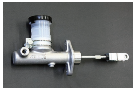
5/8クラッチマスターシリンダー (汎用タイプ) 適合 : S30, GC110, C130, 510 価格 : ¥13,500 (2026.4.9更新)