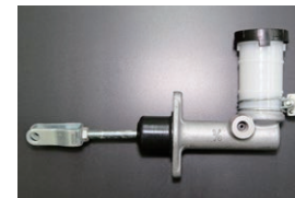
5/8クラッチマスターシリンダー 適合 : KPGC10, PGC10 (GT-R用) サイズ : 5/8 価格 : ¥23,000 (2025.7.21追加)