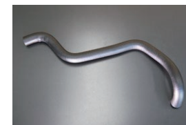
S30マスターバックホース (キャブ側) ¥3,500 ※日産品番 47474-E4101 相当品 (432Zは除く) (2025.11.24追加)