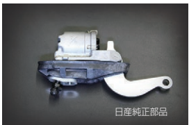
7/8大容量ホイールシリンダー 適合 : GC10,GC110,510 価格 : ¥49,100/1ヶ (更新 2026.05.07)