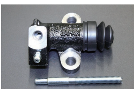
手動調整 3/4リレズシリンダー 適合 : GC10/S30前期 サイズ : 3/4 価格 : ¥10,800 (2026.4.9更新)