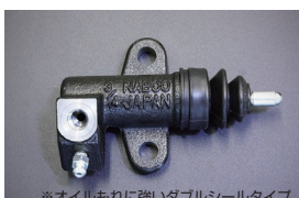
L型 3/4 リレズシリンダー Assy 品番 : 30620-69F70-W サイズ : 3/4 (ダブルシールタイプ) 適合 : L型全車 (自動調整タイプ) 価格 : ¥6,650 ※オイルもれに強いダブルシールタイプ