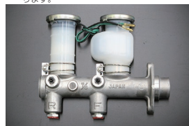
P330 ブレーキマスターシリンダー サイズ : 7/8 (日産純正ナブコ製) 適合 : リヤドラム車 (L20/L28) (75.6~79.5) 価格 : ¥88,000 (更新 2026.06.04)