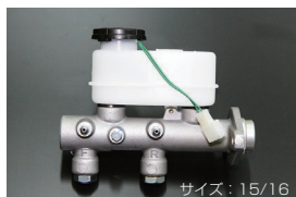
S130 ブレーキマスターシリンダー (後期 左ハンドル車用) 適合 : 81.10~83.8 (L20E) 81.10~83.8 (L28E) 価格 : ¥42,000