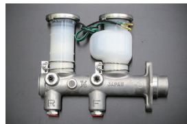
KHC130 ブレーキマスターシリンダー サイズ : 7/8 (日産純正ナブコ製) 適合 : リヤドラム車 (L20) (75.10~80.10) 価格 : ¥88,000 (更新 2026.06.04)