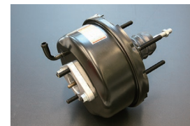
GC110 後期マスターバック (更新 2026.5.18) 後期用ビックサイズです。(162φ) 前期に付ければ制動力アップ。 ¥77,600 ※ボディ加工とスペーサーでGC10取付可