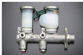
GC110 ブレーキマスターシリンダー サイズ : 7/8 (日産純正ナブコ製) 適合 : GC110後期型、GC111 (リヤドラム車 75.10~77.7) 価格 : ¥88,000 (更新 2026.06.04)