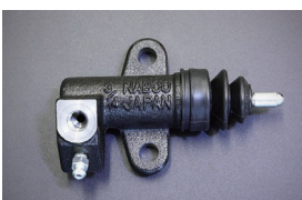
L型 3/4 リレズシリンダー Assy 品番 : 30620-U7001-S サイズ : 3/4 (シングルシールタイプ) 適合 : L型全車 (自動調整タイプ) 価格 : ¥7,450 (2026.4.9更新)