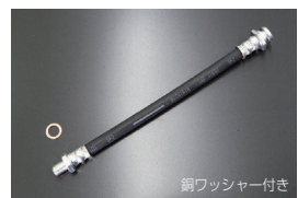
S30, S31, PS30 純正クラッチホース ・全長 : 230mm (ねじ部込み) ・適合 : S30,S31,PS30 ・価格 : ¥3,270 (2026.4.9更新)