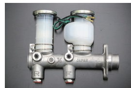
S30 ブレーキマスターシリンダー サイズ : 7/8 (日産純正ナブコ製) 適合 : S30,S31 (75.8~78.9) 価格 : ¥88,000 (更新 2026.06.04)