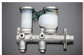
GC210 ブレーキマスターシリンダー サイズ : 7/8 (日産純正ナブコ製) 適合 : リヤドラム車 (L20E) (77.8~81.7) 価格 : ¥88,000 (更新 2026.06.04)