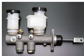
SR311 ブレーキマスターシリンダー サイズ : 3/4 適合 : SR311,SP311 (67.5~70年) 価格 : ¥59,000 ※右ハンドル車はフッシュロッドを現行品と差し替えて使用。左車はホルトオン