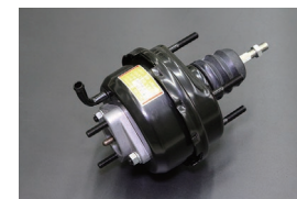
GC110 前期マスターバック サイズ: 外径143φ (ツマ部) ※スペーサー使用でハコスカ流用可 価格: ¥80,300 (2026.4.10更新) ※在庫限り