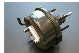
GC110 後期マスターバック (更新 2026.5.18) 後期用ビックサイズです。(162φ) 前期に付ければ制動力アップ。 ¥77,600 ※ボディ加工とスペーサーでGC10取付可