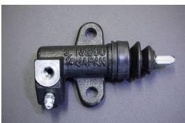
L型 3/4 リレズシリンダー Assy 品番: 30620-U7001-S サイズ: 3/4 (シングルシールタイプ) 適合: L型全車 (自動調整タイプ) 価格: ¥7,450 (2026.4.9更新)