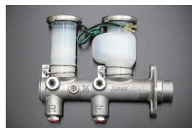
GC210 ブレーキマスターシリンダー サイズ: 7/8 (日産純正ナブコ製) 適合: リヤドラム車 (L20E) (77.8~81.7) 価格: ¥89,000 (廃止 2026.4.9)