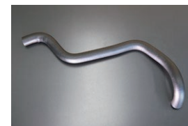
S30マスターバックホース (キャブ側) ¥3,500 ※日産品番 47474-E4101 相当品 (432Zは除く) (2025.11.24追加)