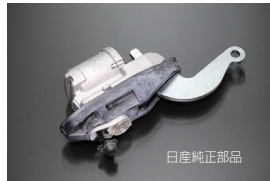
13/16標準ホイールシリンダー 適合: GC10, GC110, 510 価格: ¥63,900/1ヶ (更新 2026.05.07)