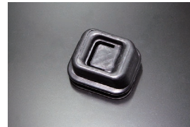
SR311クラッチフォークブーツ 適合: SR311全車/SP311 (後期) ※5速ミッション用 価格: ¥4,000