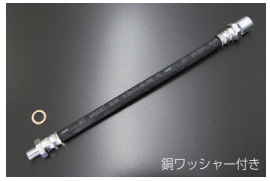
GC10, KPGC10 純正クラッチホース ・全長: 260mm (ねじ部込み) ・適合: GC10, KGC10, KPGC10 ・価格: ¥2,580 (2026.4.9更新)