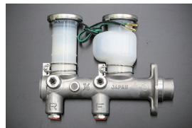
KHC130 ブレーキマスターシリンダー サイズ: 7/8 (日産純正ナブコ製) 適合: リヤドラム車 (L20) (75.6~80.10) 価格: ¥89,000 (廃止 2026.4.9)