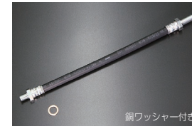
SR311/SP311 純正クラッチホース ・全長: 275mm (ねじ部込み) ・適合: SR311/SP311全車 ・価格: ¥4,210 (2026.4.9更新)