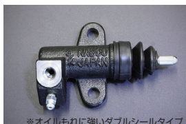
L型 3/4 リレズシリンダー Assy 品番: 30620-69F70-W サイズ: 3/4 (ダブルシールタイプ) 適合: L型全車 (自動調整タイプ) 価格: ¥6,650 ※オイルもれに強いダブルシールタイプ