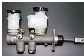
SR311 ブレーキマスターシリンダー サイズ: 3/4 適合: SR311, SP311 (67.5~70年) 価格: ¥59,000 ※右ハンドル車はフッシュロッドを現行品と差し替えて使用。左車はホルトオン