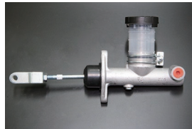
5/8クラッチマスターシリンダー 適合: GC10, KGC10 (GT, GTX用) サイズ: 5/8 ※クベビスは純正に交換必要 価格: ¥15,000