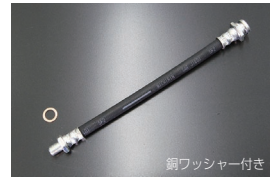
S30, S31, PS30 純正クラッチホース ・全長: 230mm (ねじ部込み) ・適合: S30, S31, PS30 ・価格: ¥3,270 (2026.4.9更新)