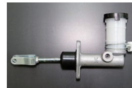
5/8クラッチマスターシリンダー 適合: KPGC10, PGC10 (GT-R用) サイズ: 5/8 価格: ¥23,000 (2025.7.21追加)