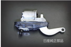
7/8大容量ホイールシリンダー 適合: GC10, GC110, 510 価格: ¥49,100/1ヶ (更新 2026.05.07)