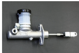
5/8クラッチマスターシリンダー (汎用タイプ) 適合: S30, GC110, C130, 510 価格: ¥13,500 (2026.4.9更新)