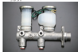
P330 ブレーキマスターシリンダー サイズ: 7/8 (日産純正ナブコ製) 適合: リヤドラム車 (L20/L28) (75.6~79.5) 価格: ¥89,000 (廃止 2026.4.9)