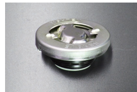
ブレーキマスターシリンダーキャップ 品番: K2401 適合: S30, S31, GC10~GC210 KHC130, P330 他 価格: ¥2,980 (廃止 2026.4.9)