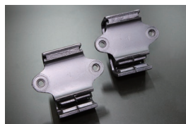
S30,S130 純正エンジンマウントSET

原動機：L20、L24、S20 適合：S30、PS30、S130 価格：¥9,960/SET (2025.2.14 更新)