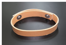
S30 強化デフアレーシアルベルト

原動機：L20、L24、S20 適合：S30、PS30 価格：¥4,870 (2025.10.12 更新)