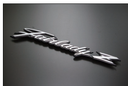
S30 Fairady-Z エンブレム

・穴の芯間長さ 59mm ・板の厚み 13mm ・価格 ¥8,800/2ヶSET (2025.4.14 更新)