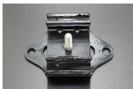
S30 純正ミッションマウント

原動機：L20 適合：S30、S31 価格：¥6,480 (2025.2.14 更新)