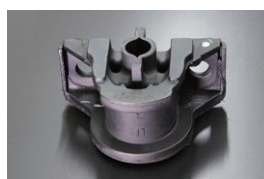
S130 R200純正デフマウント

適合：S30,HS30 (~ 74.10まで) 価格：¥13,000 (2025.4.14 更新)