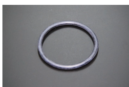
フューエルゲージ オリング

適合：S30,SR311,SP311 GC10,GC110,510,C130,230,330 価格：¥1,260 (2025.4.14 更新)