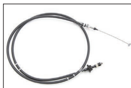
Z31 後期アクセルワイヤー

適合：Z31(RB20) ~1985.10 (18200-11P00 相当品) 価格：¥16,000 ※オートクルーズ車不可