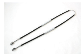
S30 前期サイドブレーキワイヤー

価格：¥4,070 ※2025.2.14 価格変更 (2025.2.14 更新)