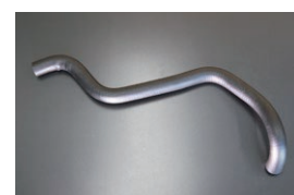
S30マスターバックホース(キャブ側)

¥3,500 ※日産品番 47474-E4101 相当品 (432Zは除く) (2025.11.24 追加)