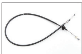
Z31 前期アクセルワイヤー

適合：Z31(RB20) ~1985.10 (18200-11P00 相当品) 価格：¥16,000 ※オートクルーズ車不可