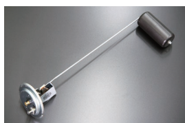
S30前期フューエルタンクユニットゲージ

(複製品 36543-N3000 相当品) ¥27,000 (2025.7.20 更新)