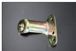
S30 アクセルリンクサポート

※フェンダー用(日産純正 金属製) (2025.2.14 更新) 価格：¥19,300/1ヶ