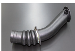
S30.240Z フューエルタンクホース

適合：S30,SR311,SP311 GC10,GC110,510,C130,230,330 価格：¥1,260 (2025.4.14 更新)