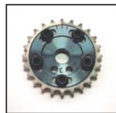
FJ20 E (T)