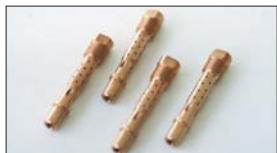
●SOLEXレース用ジェットブロック 44φ50φ共用タイプ ・片寄りに強い12mmロングタイプ ・ベース円及び円形の変更に大幅な雾化効率アップ 本体 ¥5,000