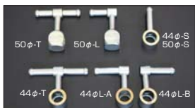
●SOLEX フューエルパイプ 44φ T型 本体 ¥4,000 44φ L-A/L-B型 本体 ¥3,300 50φ T型 本体 ¥4,000 50φ L型 本体 ¥4,000 44φ-S/50φ-S型 本体 ¥4,000