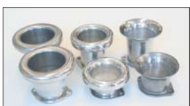
●44~45φ用ファンネル SOLEX 標準タイプ 50 mm 本体 ¥3,500 SOLEX 標準タイプ 75 mm 本体 ¥5,800 カルファンネル 45 mm 本体 ¥5,000 カルファンネル 70 mm 本体 ¥5,500 カルファンネル 80 mm 本体 ¥8,000