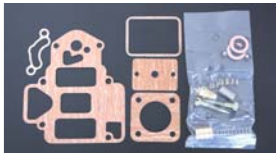
●OERリペアキット 45φ 本体 ¥5,500 47φ 本体 ¥5,500 50φ 本体 ¥5,500