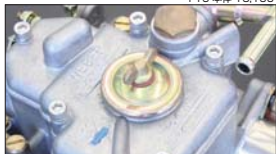
●WEBER ステンレスボルトセット 適合：WEBER 40~50φ 5本SET (L=20mm×1 L=25mm×4)