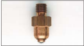
●WEBER ニードルバルブ #175 本体 ¥3,500 #200 本体 ¥3,500 #225 本体 ¥3,500 #250 本体 ¥3,500