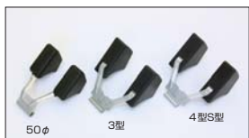
●SOLEX フロート 50φ 用 本体 ¥4,000 3型 本体 ¥3,300 4型S型 本体 ¥3,300