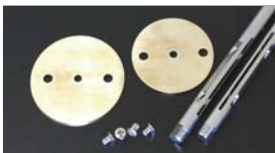
●SOLEX バタフライ 44φ 本体 ¥3,650 50φ 本体 ¥4,550 ●SOLEX スロットルシャフト 44φ 本体 ¥5,340 50φ 本体 ¥6,170 ●バタフライストッパーボルト 1ヶ 本体 ¥150