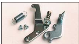
●SOLEX サイドレバーkit 3型、4型、50φ 本体 ¥5,230