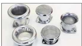
●40φ用ファンネル SOLEX/OER 50 mm 本体 ¥3,200 カルファンネル 45 mm 本体 ¥4,500 カルファンネル 70 mm 本体 ¥5,000 ネット付ファンネル 30/50 mm 本体 ¥3,000