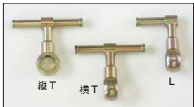
●WEBER フューエルパイプ Lパイプ 本体 ¥3,500 Tパイプ 本体 ¥3,500 縦向きTパイプ 本体 ¥3,500