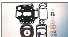
●SOLEX オーバーホールキット 40φ S型 3型4型 本体 ¥4,130 44φ 3型4型 本体 ¥4,130 50φ 2型 本体 ¥4,130