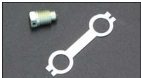
●WEBER ベンチュリーストッパーボルト 適合：WEBER 40~50φ ・ベンチュリーストッパーボルト 本体 ¥1,000 ・ロックワッシャー 本体 ¥450