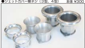
●50φ用ファンネル SOLEX 50φ 35 mm 本体 ¥6,500 SOLEX 50φ純正 50 mm 本体 ¥8,000 WEBER50φ 75 mmカル 本体 ¥9,500