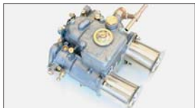
●WEBER45φキャブレター 45DCOE-152 本体 ¥66,000 /1基 45DCOE-9 本体 ¥75,000 /1基