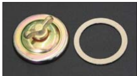
●WEBER ジェットカバー 適合：WEBER 40~50φ ・ジェットカバー 本体 ¥3,200 ・ジェットカバーパッキン 本体 ¥300