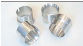
●WEBER 45φアウターベンチュリー (ジュラルミン製) 38φ 本体 ¥3,500 40φ 本体 ¥3,500 ※DCOE9用とDCOE152用あり