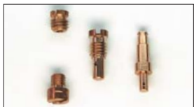
●SOLEX ジェット メインジェット 本体 ¥640 エアージェット 本体 ¥640 パイロットジェット 本体 ¥640 ポンプジェット 本体 ¥1,200