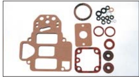
●WEBER パッキンセット 本体 ¥3,700