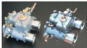
●WEBERキャブレター 40φ 本体 ¥66,000 /1基 48φ50φ 本体 ¥89,000 /1基