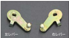
●WEBER スロットルレバー 適合：WEBER 40~45φ ・スロットル右レバー 本体 ¥3,000 ・スロットル左レバー 本体 ¥3,000