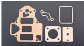
●OERパッキンセット 45φ 本体 ¥1,200 47φ 本体 ¥1,200 50φ 本体 ¥1,200