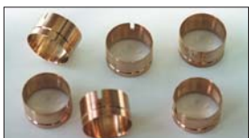
●SOLEX 44φアウターベンチュリー (シンチュウ製) 36φ 本体 ¥3,500 38φ 本体 ¥3,500 40φ 本体 ¥3,500