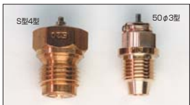
●SOLEX ニードルバルブ S型4型 50φ3型 #1.8 本体 ¥2,850 本体 ¥3,150 #2.0 本体 ¥2,850 本体 ¥3,150 #2.3 本体 ¥2,850 本体 ¥3,150