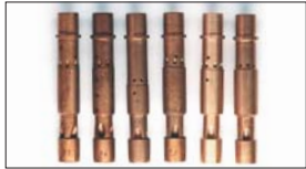
●WEBER イオンジェット F2 本体 ¥3,100 F4 本体 ¥3,100 F7 本体 ¥3,100 F9 本体 ¥3,100 F11 本体 ¥3,100 F16 本体 ¥3,100