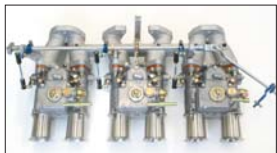
●L28 WEBER45φキット 45DCOE-152キット 本体 ¥220,000 45DCOE-9キット 本体 ¥244,000 ※45φインマニ、インマニG/K、フューエルホース ホースバンド、インシュレーター付き