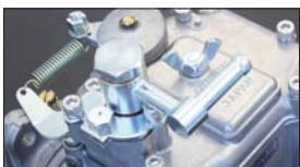
●チャンバーカーブステンレスボルトSET SOLEX (S型) 本体 ¥1,600 SOLEX (4型) 本体 ¥1,400 SOLEX (ニスモ4型) 本体 ¥1,400 SOLEX (50φ 3型) 本体 ¥900 ●ジェットカバー-螺ネジ (3型、4型) 本体 ¥300