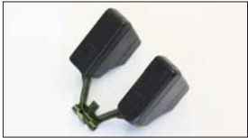
●WEBER フロート プラスチックフロート 本体 ¥7,000