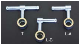
●OERフューエルパイプ 40φ~50φ T型 ¥3,000 L-A/L-B型 ¥2,800