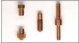
●WEBER ジェット メインジェット 本体 ¥600 エアージェット 本体 ¥600 スロージェット 本体 ¥700 ポンプノズル 本体 ¥1,600