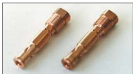
●SOLEX 純正ジェットブロック 44φ 純正OA 本体 ¥3,300 50φ 純正OB 本体 ¥3,300