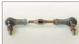
●ターンバックル (両ピロ) 本体 ¥3,600 ピロボールを使用することでガタを少なくできスポーツ走行で外れる心配も解消できる。