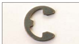
●Eリング 本体 ¥80 ステンパーのロックに使用。