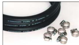
●8mm フューエルゴムホース 1m 本体 ¥1,000 ●ステンバンド 本体 ¥280