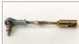
●ターンバックル (片ピロ) 本体 ¥3,100 ソレックスの場合はキャブ側のボールが外れないため片ピロタイプがとってでも簡単。