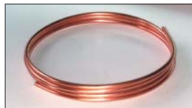
●8mm銅パイプ (3m巻き) 本体 ¥3,000 (4m巻き) 本体 ¥4,000 燃料配管用の銅パイプです。なまし材なので、しなやかに曲げられて便利。(1m ¥1,000単位で切り売り可)