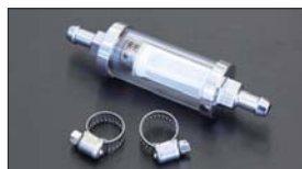
●マグネット付燃料フィルター 本体 ¥3,500 ※分解清掃可能なガラス管タイプのフィルターで、内部に仕込まれたマグネットがゴミや鉄粉をキャッチします。 (ホースバンド2個付属)