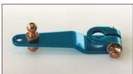
●アルミ押しレバー 本体 ¥2,200 (軸径：8φ 10φ) 緩みに強いニュータイプ。ボルトとナットでしっかり固定できる。 ※アルミニウム製品