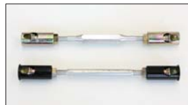
●2TG, 18RGロングターンバックル ・ブラック (プラスチック) 本体 ¥1,900 ・ゴールド (シンチュウ) 本体 ¥2,500