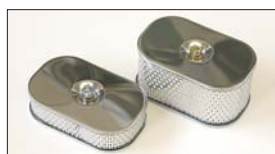
●エアークリーナー (SOLEX, WEBER, OER用) 45mm厚 本体 ¥3,800 80mm厚 本体 ¥4,400 ●交換用フィルター 45mm ¥1,800/80mm ¥2,400