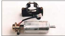
●大容量フューエルポンプ 本体 ¥36,300 ※吐出量 2.2L/分 (入口12φ出口8φ 本体54φ) ●フューエルポンプブラケット 本体 ¥1,790