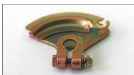
●オオギレバー 本体 ¥1,900 ワイヤード式でスロットルを操作させるレバー。日産用、トヨタ用あり。