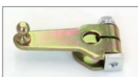
●強化タイプ押しレバー 本体 ¥2,800 緩みやクラックに強いステンレス素材使用で耐久性抜群。 ※芯間距離40mm 軸径10φ用