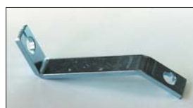
●L型用ワイヤー受け 本体 ¥1,200 ワイヤーを受け止めるためのブラケットでエンジン型式によって種類あり。