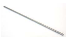
●ステンパー ・L6 1001用 本体 ¥3,000 ・L6 1002用 本体 ¥3,000 ・A型、L4, FJ20, Z20, 4K, 4AG 本体 ¥2,000