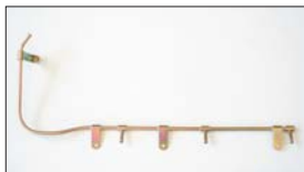
●L型3連フューエルパイプ 本体 ¥4,500