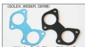
(SOLEX, WEBER, OER用) ●インシュレーターパッキン 40φ用 44φ用 50φ用 各 ¥300/1枚 ●インシュレーター 40φ用 44φ用 50φ用 各 ¥2,200/1枚 ¥2,500/1枚