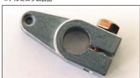
●戻しレバー 本体 ¥1,000 リターンスプリングの強さを調整するレバー。