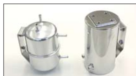
●コレクタータンク 上3下1ホース口タイプ (円筒) 本体 ¥20,000 上4下2ホース口タイプ (円筒) 本体 ¥19,500 ※上4下2タイプは、ホース口別売です。