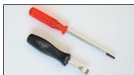
●ジェットブロックドライバー (SOLEX, WEBER共用) 本体 ¥4,000 ●エアージェットドライバー (SOLEX用) 本体 ¥1,430