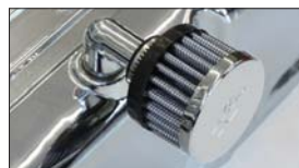
●プロローパイプフィルター 本体 ¥2,900 適合：L型、A型、2TG、18RG他 ※16φ口用