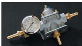
●燃圧計&レギュレーターセット 本体 ¥15,000 デュアル出口のリターン無しタイプ。 ・HOLLY レギュレーターのみ 本体 ¥12,000