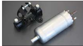
●ボッシュ大容量フューエルポンプ 本体 ¥30,000 ※吐出量 3.1L/分 (L30~L31向け) (入口12φ出口8φ 本体52φ全長180mm) ●フューエルポンプブラケット 本体 ¥1,790