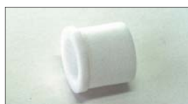
●テフロンプッシュ 本体 ¥700 ステンパーの揺動部に使用。インマニ1台に2ヶ必要。(プッシュ式インマニ用)