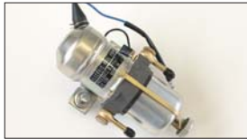
●ミツバフューエルポンプ 本体 ¥18,000 ※吐出量 1.4L/分 最大吐出圧 0.3kg/cm 2 交換用フィルター 本体 ¥1,300