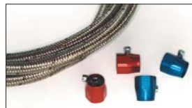
●ステンメッシュフューエルホース#6 1m 本体 ¥5,000 ●アルズエコバンド#6 本体 ¥850