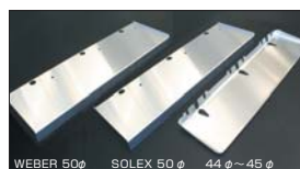
WEBER 50φ SOLEX 50φ 44φ~45φ ●L型 アルミヒートプレート (狭み込みタイプ) SOLEX, WEBER, OER 40φ~45φ 本体 ¥5,500 ●L型 アルミヒートプレート (つり下げタイプ) SOLEX 44, 50φ ※金具付き 本体 ¥7,000 WEBER 50φ ※金具付き 本体 ¥6,000