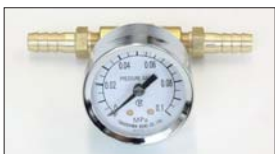
●40φ燃圧計 本体 ¥5,000 0~0.1MP (0~1kg/cm 2 ) エンジンルームに取り付け可能なキャブ専用燃圧計。 ※振動による針振れ防止機能付き。