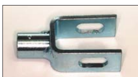
●L字のジョイント 本体 ¥2,000 ステンパーのジョイントパーツ。(L4, L6用)