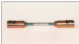
●ターンバックル (ゴールド) 本体 ¥2,000 ゴールドの部分はシンチュウ製でヒビ割れに強い。