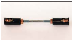
●ターンバックル (ブラック) 本体 ¥1,800 インマニに標準的に付属されているアフターパーツでブラックの部分はプラスチックで出来ている。