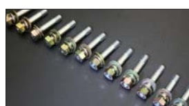
●インマニスタッドボルト 本体 ¥380/1本 ※ナット&ワッシャー付き