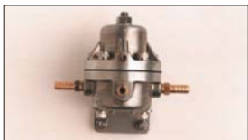
●大容量フューエルレギュレーター 本体 ¥16,000 ※キャブの燃料圧を調整及び安定させる為の必需品！ メカポンプ及び3インジェクションポンプに対応できる 大容量タイプ。