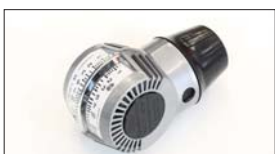
●キャブバルancer/エアフロタイプ 本体 ¥10,000 ※適合：SOLEX40~50φ WEBER40~48φ OER40~50φ キャブに当てたままでもアイドリングが下がらない新機構で簡単にキャブ調整ができます。