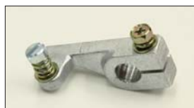
●調整レバー 本体 ¥1,500 押しレバーによるスロットル開度を微調整するときが必要。