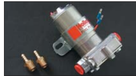
●HOLLYフューエルポンプ 本体 ¥19,800 ※吐出量 4226cc/分の大容量タイプ