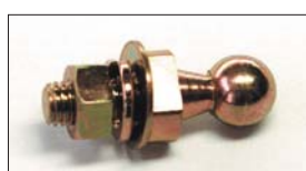
●ボールジョイント 本体 ¥530 押しレバーの先端に使用しているパーツ。