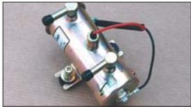
●ニモフューエルポンプ 本体 ¥11,500 ※吐出量 1.3L/分 最大吐出圧 0.45kg/cm 2 交換用フィルター 本体 ¥1,500