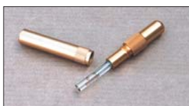
●油面ゲージ 本体 ¥4,500 ※SOLEX, WEBER, OERキャブに使用できる。 簡単ワンタッチ、ガラス管タイプ！