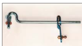
●L6ジョイント 本体 ¥5,000 L6ロッド式インマニの構成部品でリンクagesをロッドで駆動するためのジョイントパーツ。