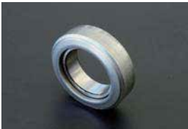
トヨタクラッチリリースベアリング