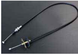
GC10/GC110 アクセルワイヤー