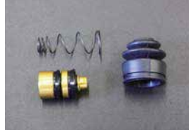
L型 大容量クラッチリリースシールキット

品番: CK-4100 サイズ: 3/4 適応: S130, GC210 価格: ¥860