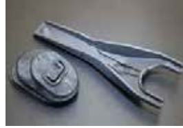
L型 クラッチフォーク&ブーツ SET

品番: 30620-U7001 サイズ: 3/4 適応: L型全車 価格: ¥5,030