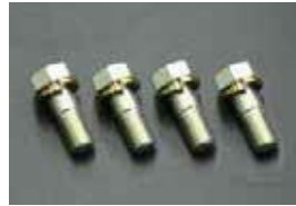
MK63 キャリパー取り付けボルト