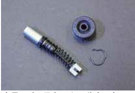
クラッチマスター シールキット

品番: AY505-NS014 適応: 8mm ホース, キャブ車専用 価格: ¥1,260 ¥1,500