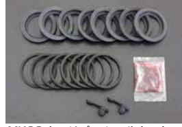
MK63 キャリパー シールキット

品番: TK-9100 (トキコ 7/8) 適応: S47~S30, S31 S50~GC110, GC210 価格: ¥5,020 ¥8,130