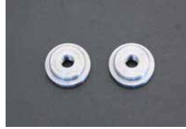
R180 ボルトタイプ変換パーツ

品番: 38433-RS610 サイズ: 3/4 厚み: 1.90mm 価格: ¥2,700