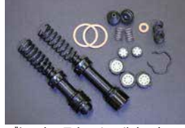
ブレーキマスター シールキット

品番: MK-N206 (5/8) 適応: S130, GC110前期 価格: ¥1,600 ※下側にボルトがあるタイプ