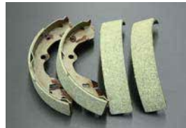
S30 NISMO ブレーキライニング

(歯数 31/22 L28 用) ¥25,400 ¥25,900 L20 ベースミッションでタイプB クロスを組むときに使用。