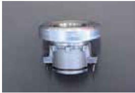
L型 スリーブ&ベアリングセット