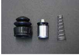
L型 クラッチリリースシールキット

品番: CK-4101 サイズ: 11/16 適応: S30, GC10, GC110 価格: ¥680 ¥940