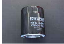
オイルフィルター

品番: 15208-78525 適応: S20 (G7共通) 価格: ¥1,310