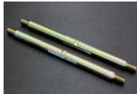
S30 リアロアームスピンドル

¥1,650/1本 ¥2,200/1本 ・ロアームプッシュの交換時に 固着したスピンドルを交換