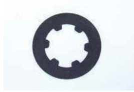
R180 LSD フリクションディスク

品番: 38433-RS610 サイズ: 3/4 厚み: 1.90mm 価格: ¥2,700