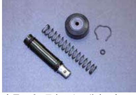
クラッチマスター シールキット

品番: MK-N204 (5/8) 適応: GC110後期, GC210, C130 価格: ¥1,520 ¥2,130 ※下側にボルトがないタイプ