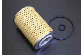
オイルフィルター

品番: AY100-NS007 適応: A12~A15 FJ20, U20 価格: ¥1,150