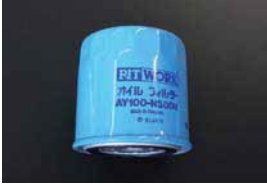
オイルフィルター

品番: AY100-NS008 適応: L20~L28 L14~L18 Z18, Z20, FJ20 価格: ¥1,450