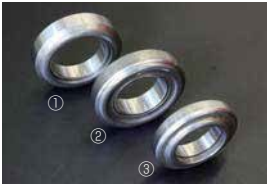
日産クラッチリリースベアリング

・サークリップ式のデフをボルトタイプに変換して GC10 や S30 に使用するためのパーツ。 ¥6,000/1SET