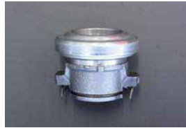
L型 スリーブ&ベアリングセット

OS ツイン TS2A (24mm) ¥4,790 OS ツイン TS2AD (18mm) ¥6,380 OS ツイン TS2BD (16mm) ¥5,310