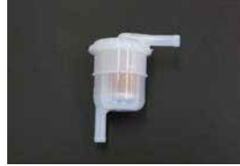
汎用フューエルフィルター

品番: AY100-TY017 適応: 2TG, 18RG, 3K, 4K 価格: ¥1,000