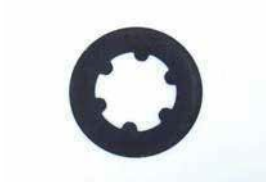
R200 LSD フリクションディスク

品番: 38433-N3211 サイズ: 3/4 厚み: 1.85mm 価格: ¥900