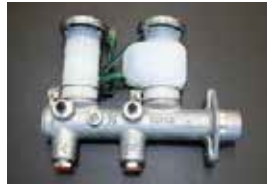
7/8 ブレーキマスターシリンダー