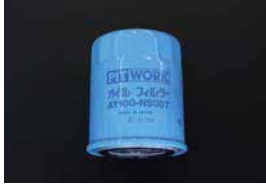
オイルフィルター

品番: AY100-NS008 適応: L20~L28 L14~L18 Z18, Z20, FJ20 価格: ¥1,450