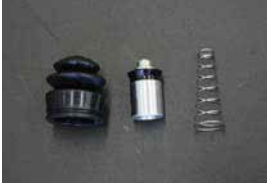
L型 クラッチリリースシールキット

品番: MK63-NS053 適応: MK63 4 ポットキャリパー 価格: ¥9,620 ¥5,720