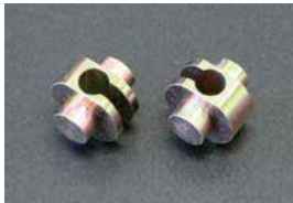
サイドブレーキワイヤー止めゴマ