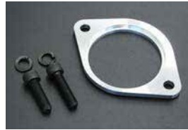
L型 セルモータースペーサー

後期用ビックサイズです。(162φ) 前期に付けば制動力アップ。 ¥29,000 ¥24,900 ¥41,400 ¥42,200