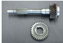
71B メインドライブギヤセット

¥1,650/1本 ¥2,200/1本 ・ロアームプッシュの交換時に 固着したスピンドルを交換