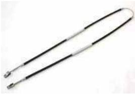
S30 前期サイドブレーキワイヤー

適合: S30 後期, S31 年式: S51.5~ 材質: フェロド AM4 価格: ¥6,000/1台 販売終了 ※箱に汚れありご了承ください。