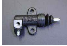
L型 3/4 リリースシリンダー Assy

サイズ: 13/16 適応: 大容量リリースシリンダー (ダブルシールタイプ) 価格: ¥2,500