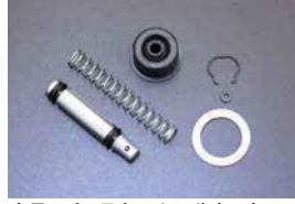
クラッチマスター シールキット

品番: FC-30420 (5/8) 適応: S30, S31 価格: ¥3,000