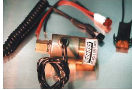
ラインロック本体