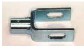
●コの字ジョイント 本体 ¥2,000 ステンパーのジョイントパーツ。(L4, L6用)