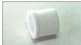
●テフロンブッシュ 本体 ¥700 (軸径：10φ) ステンパーの摺動部に使用。インマニ1台に2ヶ必要。(ブッシュ式インマニ用)