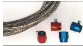
●ステンメッシュフューエルホース#6 1m 本体 ¥5,000 ●アールズエコバンド#6 本体 ¥850