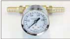
●40φ燃圧計 本体 ¥5,000 0~0.1MP (0~1kg/cm 2 ) ※キャブの燃料圧を調整及び安定させる為の必需品！ エンジンルームに取り付け可能なキャブ専用燃圧計。 ※振動による針振れ防止機能付き。