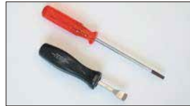
●ジェットブロックドライバー (SOLEX, WEBER共用) 本体 ¥4,500 ●エアージェットドライバー (SOLEX用) 本体 ¥1,750