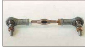
●ターンバックル (両ピロ) 本体 ¥3,600 ピロボールを使用することでガタを少なくできスポーツ走行で外れる心配も解消できる。