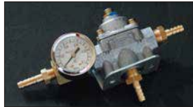
●燃圧計&レギュレーターセット 本体 ¥15,000 デュアル出口のリターン無しタイプ。 ・HOLLY レギュレーターのみ 本体 ¥12,000