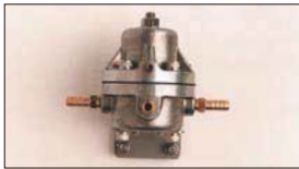
●大容量フューエルレギュレーター 本体 ¥16,000 ※キャブの燃料圧を調整及び安定させる為の必需品！ メカポンプ及びインジェクションポンプに対応できる 大容量タイプ。