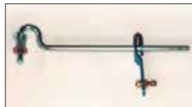
●L6ジョイント 本体 ¥5,000 L6ロッド式インマニの構成部品でリングをロッドで駆動するためのジョイントパーツ。