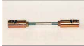
●ターンバックル (ゴールド) 本体 ¥2,000 ゴールドの部分はシンチュウ製でヒビ割れに強い。