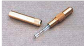
●油面ゲージ 本体 ¥4,500 ※SOLEX, WEBER, OERキャブに使用できる。 簡単ワンタッチ、ガラス管タイプ！