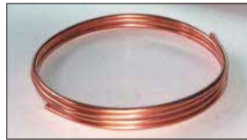
●8mm銅パイプ (3m巻き) 本体 ¥3,000 (4m巻き) 本体 ¥4,000 燃料配管用の銅パイプです。なまし材なので、しなやかに曲げられて便利。(1m ¥1,000単位で切り売り可)