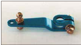
●アルミ押しレバー 本体 ¥2,200 (軸径：8φ 10φあり) 緩みに強いニュータイプ。ボルトとナットでしっかり固定できる。 ※アルミニウム製品