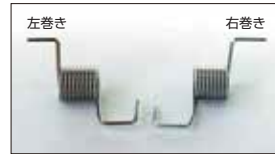
●リターンスプリング 本体 ¥600 スロットルの戻り側のスプリングでエンジン型式によって右巻きと左巻きがあり。