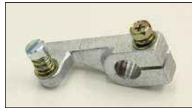
●調整レバー 本体 ¥1,500 (軸径：10φ) 押しレバーによるスロットル剛度を調整するときに必要。