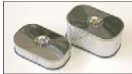
●エアークリーナー (SOLEX, WEBER, OER用) 45mm厚 本体 ¥3,800 80mm厚 本体 ¥4,400 ●交換用フィルター 45mm ¥1,800/80mm ¥2,400 ●交換用エアークリーナーパックン 本体 ¥200