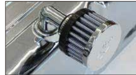
●プロバイフィルター 本体 ¥2,900 適合：L型、A型、2TG、18RG型 ※16φ口径