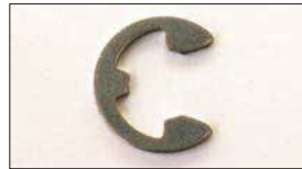
●Eリング 本体 ¥80 (軸径：8φ 10φあり) ステンパーのロックに使用。