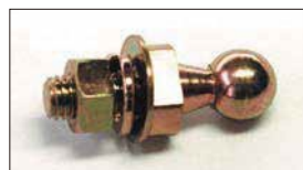
●ボールジョイント 本体 ¥530 押しレバーの先端に使用しているパーツ。