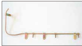
●L型3連フューエルパイプ 本体 ¥4,500