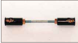
●ターンバックル (ブラック) 製造禁止 インマニに標準的に付属されているアフターパーツでブラックの部分はプラスチックで出来ている。