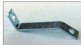
●L型用ワイヤー受け 本体 ¥1,200 ワイヤーを受け止めるためのブラケットでエンジン型式によって種類あり。