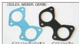
(SOLEX, WEBER, OER用) ●インシュレーターパッキン 40φ用 44φ用 50φ用 各 ¥300/1枚 ●インシュレーター 40φ用 44φ用 50φ用 各 ¥2,200/1枚 ¥2,500/1枚