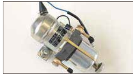
●ミツフューエルポンプ 本体 ¥18,000 ※吐出量 1.4L/分 最大吐出圧 0.3kg/cm 2 交換用フィルター 本体 ¥1,300