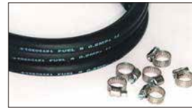
●8mmフューエルゴムホース 1m 本体 ¥1,000 ●ステンバンド 本体 ¥280