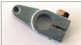
●戻しレバー 本体 ¥1,000 (軸径：8φ 10φあり) リターンスプリングの強さを調整するレバー。