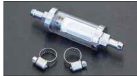
●マグネット付燃料フィルター 本体 ¥3,500 ※分解清掃可能なガス管タイプのフィルターで、内部に仕込まれたマグネットが砂や鉄粉をキャッチします。 (ホースバンド2個付属)