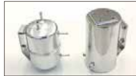
●コルクタンク 上3下1ホースロタイプ (円筒) 本体 ¥20,000 上4下2ホースロタイプ (円筒) 本体 ¥19,500 ※上4下2タイプは、ホースロ別売です。