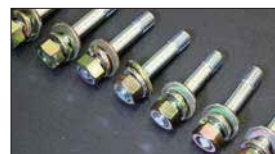
●インマニスタッドボルト 本体 ¥380/1本 ※ナット&ワッシャー付き 本体 ¥430/1本