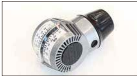
●キャブバルancer/エアフロタイプ 本体 ¥10,000 ※適合：SOLEX40~50φ WEBER40~48φ OER40~50φ キャブに当てたままでもアイドリングが下がらない新機構で簡単にキャブ調整ができます。