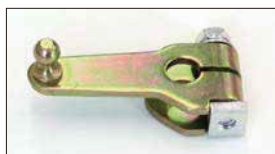
●強化タイプ押しレバー 本体 ¥2,800 緩みやクラックに強いスチール素材使用で耐久性抜群。 ※芯間距離40mm 軸径10φ用