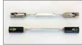
●2TG, 18RGロングターンバックル 製造禁止 ・ブラック (プラスチック) 本体 ¥2,500 ・ゴールド (シンチュウ)