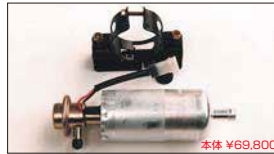
●大容量フューエルポンプ 本体 ¥69,800 本体 ¥36,300 ※吐出量 2.2L/分 (入口12φ出口8φ 本体54φ) ●フューエルポンプブラケット 本体 ¥1,790 本体 ¥1,830