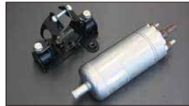
●ボッシュ大容量フューエルポンプ 本体 ¥30,000 ※吐出量 3.1L/分 (L30~L31向け) (入口12φ出口8φ 本体52φ全長180mm) ●フューエルポンプブラケット 本体 ¥1,790 本体 ¥1,830