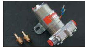
●HOLLYフューエルポンプ 本体 ¥19,800 ※吐出量 4226cc/分の大容量タイプ