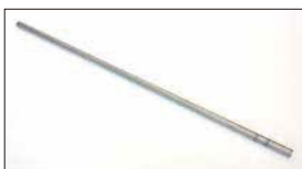
●ステンパー ・L6 1001用 本体 ¥3,000 ・L6 1002用 本体 ¥3,000 ・A型、L4、FJ20、Z20、4K、4AG 本体 ¥2,000