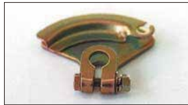
●オオギレバー 本体 ¥1,900 (軸径：8φ 10φあり) ワイヤードでスロットルを動作させるレバー。日産用、トヨタ用あり。