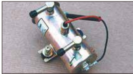
●ニモフューエルポンプ 本体 ¥11,500 ※吐出量 1.3L/分 最大吐出圧 0.45kg/cm 2 交換用フィルター 本体 ¥1,500