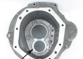
サブギアの逃げ加工