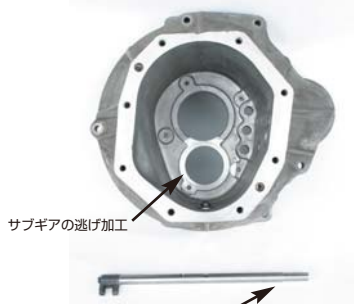
サブギアの逃げ加工