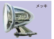
汎用フェンダーミラー (左右set) 1set ¥24,000 (ミラー径×全長×高さ) φ103×125×110