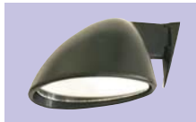
汎用ドアミラー (左右set) 1set ¥24,000 (ミラー縦×横×長さ×張出し) 92×144×101×148